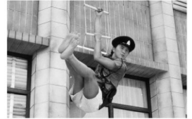
© 2010 Fortune Star Media Limited. All Rights Reserved.

監督：許冠文 出演：許冠文 許冠傑(サミュエル・ホイ) 1976年/35ミリ/カラー/99分 日本語字幕付き