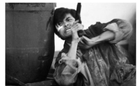
© 2010 Fortune Star Media Limited. All Rights Reserved.

組織の顔役・ホーは弟のために足を洗おうとするも、陰謀に巻き込まれ、兄弟の絆も引き裂かれる。龍剛の同原題作品のリメイクだが、吳宇森(ジョン・ウー)は自身の憧れのアクションスターの要素を取り入れてマークという人物を創造し、スローモーションなどを駆使して今でも語り継がれる数々の名場面を残した。吳宇森と周潤發(チョウ・ユンファ)の名を世界に知らしめるとともに、「香港ノワール」と称される流れの発端となった記念碑的な作品。1987年日本公開。2015年に4K修復された版を日本初上映。