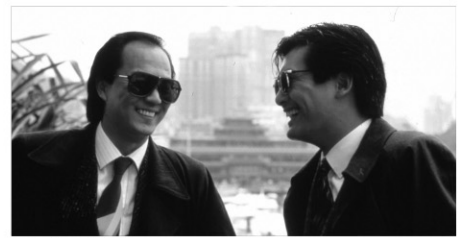
私たちの挽歌

2/16(水) 11:00 2/18(金) 11:00 2/20(日) 14:00