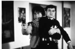
© 2017 CJ E&M CORPORATION ALL RIGHTS RESERVED

監督：成龍 出演：成龍 林青霞(ブリジット・リン) 1985年/35ミリ/カラー/104分 日本語字幕付き