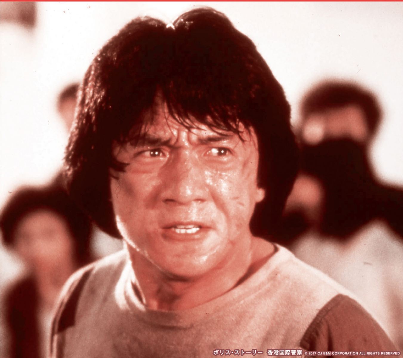
ポリス・ストーリー 香港国際警察 © 2017 CJ E&M CORPORATION ALL RIGHTS RESERVED